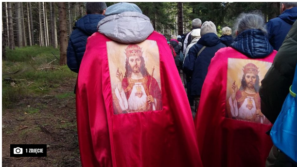
Różaniec na granicy polsko-czeskiej

Nic nie mam przeciwko odmawianiu różańca. Ale pisząc głupoty, obrażacie tych, co gorliwie się modlili, ale nie ominęły ich straszne wydarzenia II wojny światowej